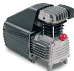
ER PND 920