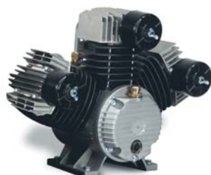
ER P 60 CV3