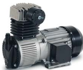
ER P 52 DT