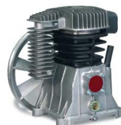
ER PNG 4