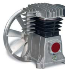
ER PNG 2,8