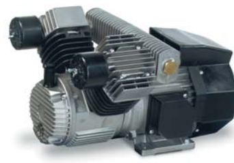
ER P 60 DVT