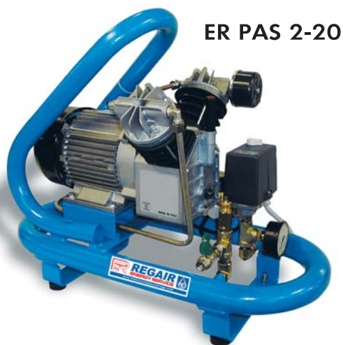
ER PAS 2-20

Compresores de pistones alta presión con tanque de 16 a 21 bar