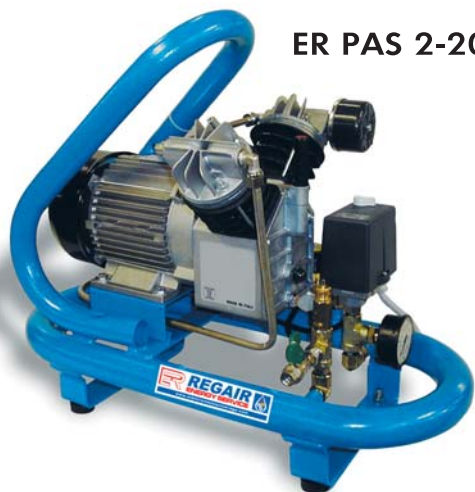
ER PAS 2-20

Compresores de pistones alta presión con tanque de 16 a 21 bar